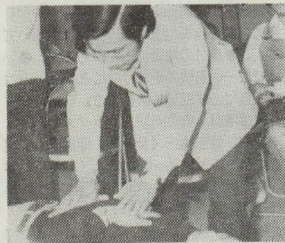
昨年の健康回復教室での腹式呼吸の訓練

市では、気管支ぜん息や肺気腫などの病気で公害病に認定されている患者さん方の健康を回復していただくため各種の事業を行っています。その一環として次のとおり「健康回復教室」を開きますのでお気軽にご参加ください。