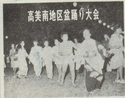
高美南地区盆踊り大会