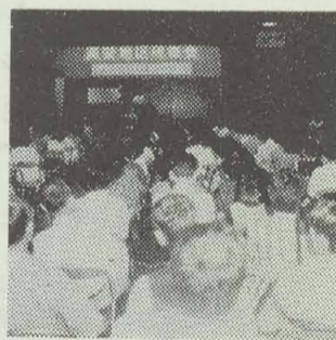
▲差別撤廃研修(高安中)