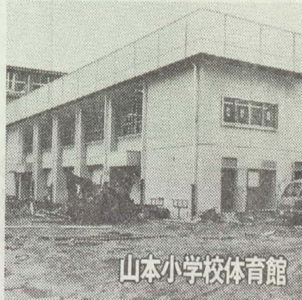
山本小学校体育館

未来をにう子どもたちに、よりよい教育環境を、と教育環境の充実をめざし学校、園の新設や増改築については人口