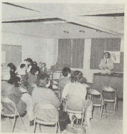
▲公害病に認定されている患者さん方への医師による講話。