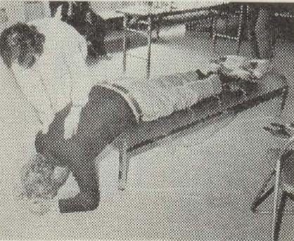
▲体の姿勢を変えることにより痰をだす方法—健康回復教室にて—

市では気管支ぜん息や肺気腫等の病気で公害病に認定されている患者さん方の健康を回復していただくため各種の事業を行っていますがその一環として「健康回復教室」を開きます。この教室では病気の簡単な知識から家庭でできる訓練を覚えていただきます。お気軽にご参加下さい。