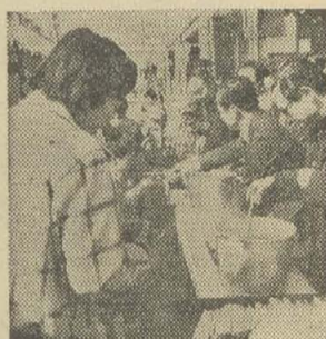
▲ 厄払いぜんざいふるまい(2月18日、表町開放道路)