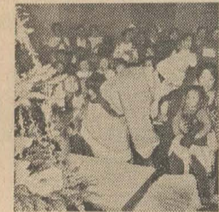
▲ 小児科病棟でクリスマスパーティー(12月22日、市立病院)