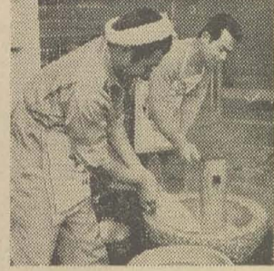
▲ 八尾清掃労働組合が老人ホームでもちつき奉仕(12月17日大竹)