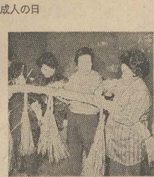
▲ 主婦たちが手作りのしめなわ作り(12月22日、宮町)