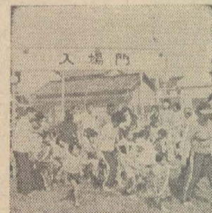
▲秋空のもと運動会さかん(9月24日、小畑町会)