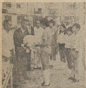
▲高安地区老人クラブ連合会が地域の小学校などにぞうきんを贈呈(9月21日)