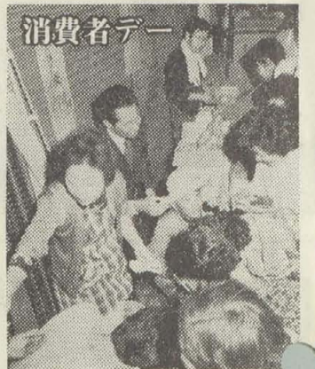
第2回八尾市消費者デーを次のとおり行います。

家児 教育 青少 法律 心配 肢体不自由児検診 13.00-14.00 八尾保健所 不用犬の受付 9.30-12.00, 13.00-16.00 八尾保健所 中小企業下請相談 13.00-16.00 府民センター 日本脳炎の予防接種 (第1回目) 14.30-15.20 山本小、長池小