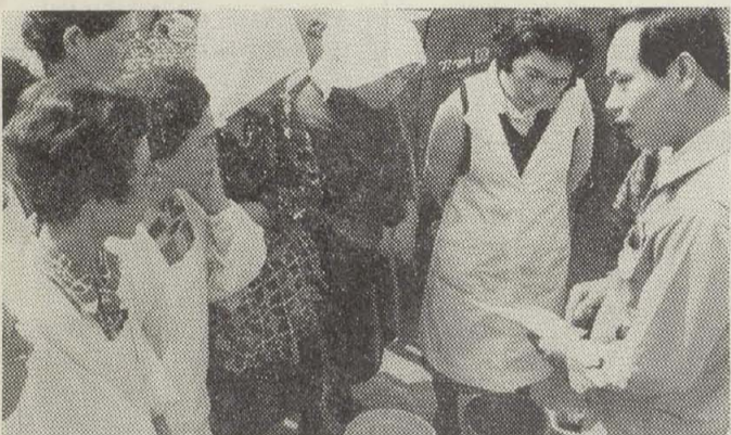
▲まず作戦を練って