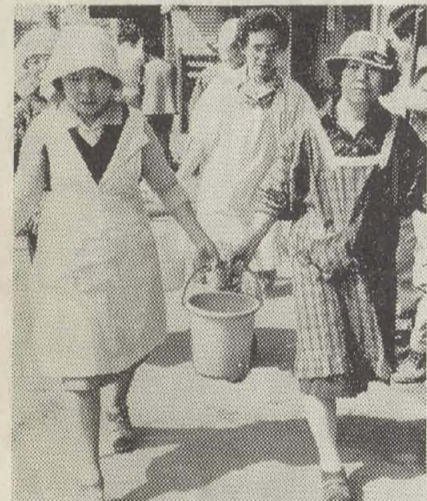
▲近所からもらった水を持っていざ出発!