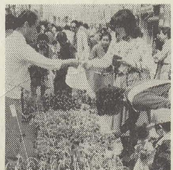
▲ 青年会議所主催の花と植木の市 (4月17日・表町開放道路)