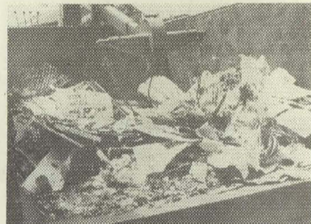
▲トラックは撤去された広告物でいっぱい