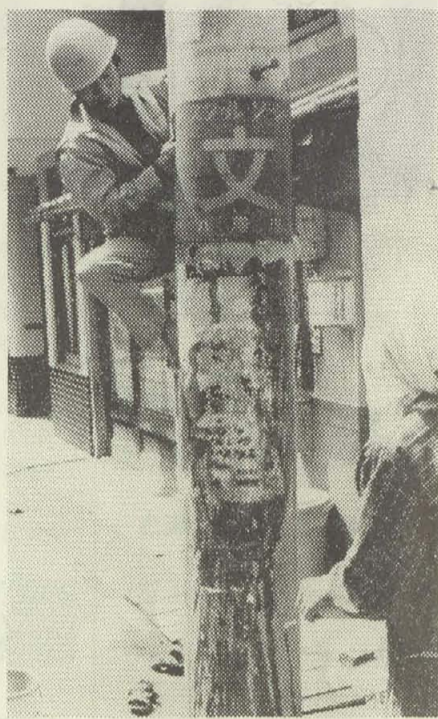
▲「高い所はワシにまかしとき」