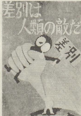
(写真) 同和教育月間入選作

また、12月10日、午後2時から社会福祉会館で人権擁護委員会主催で市赤十字奉仕団婦人部を対象に講演と座談会を行います。