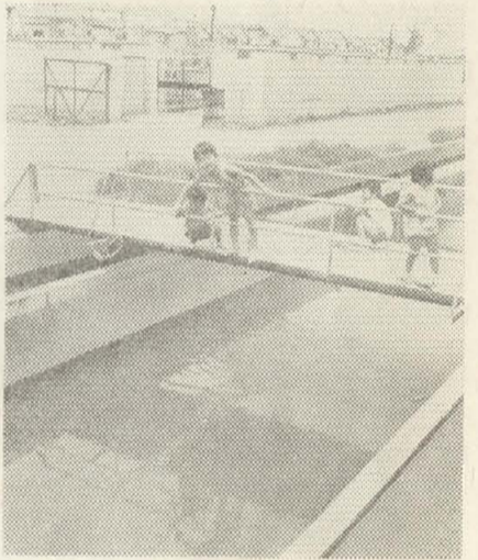
早くしよう魚が泳ぐ長瀬川に

【質問】 長瀬川の悪臭の原因が工場用排水と芝山衛生処理場の排水という事実から、その防除について、どのような行政措置をと