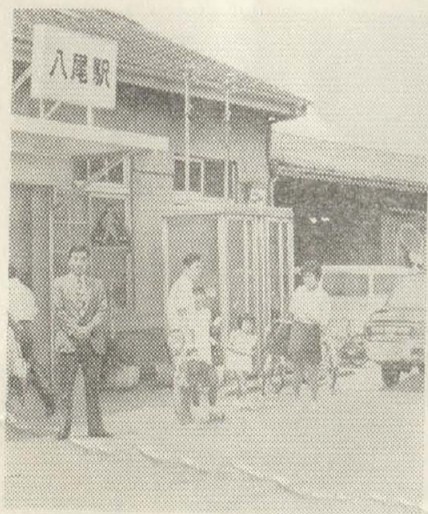
整備が待たれる国鉄八尾駅前

今後暴力により目的を達成しようとする事については、一切これを排除するため、本件については告訴することに踏み切り、今後市行政としては、一貫して毅然とした姿勢で対処していく所存である。