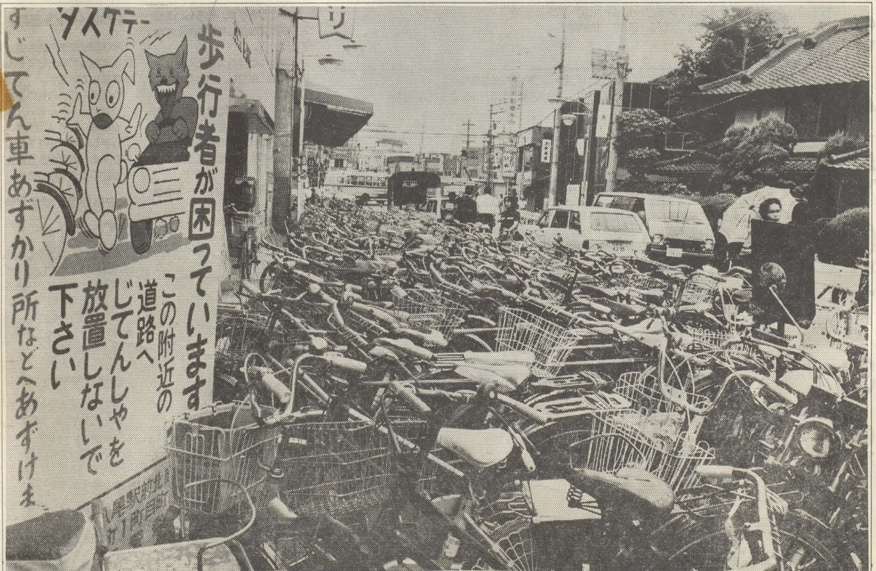
② はやくなくしたい自転車の路上放置(近鉄八尾駅北側の市道で)