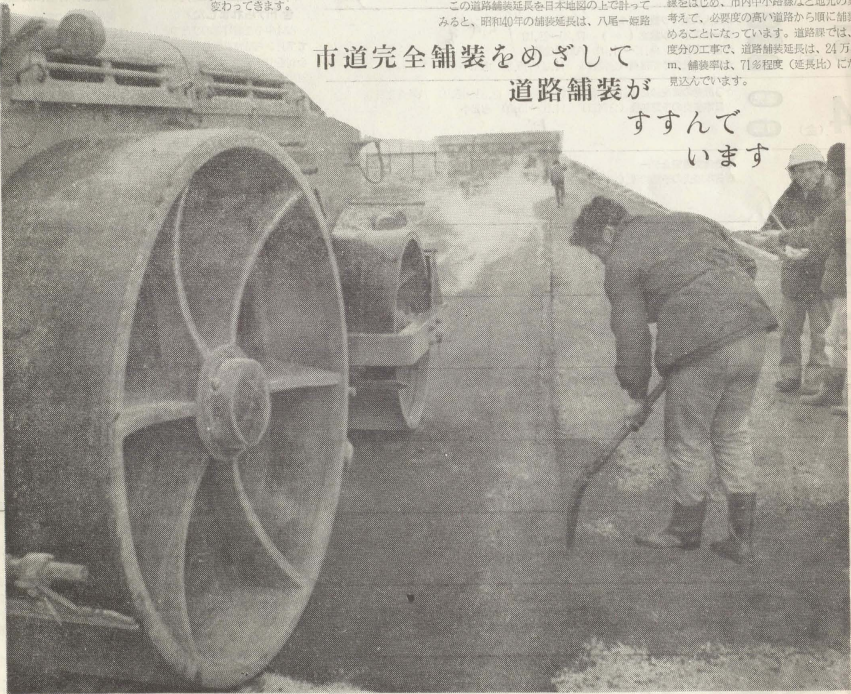
・萱振福万寺線、大正65号線などで舗装がすすんでいます