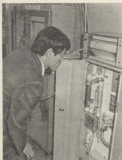
八尾保健所のオキシダント測定記録計