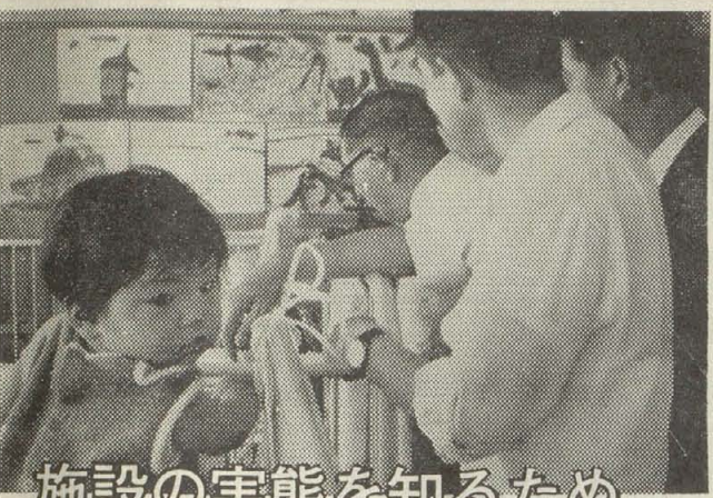
施設の実態を知るため

厚生 同和更生資金貸付基金の改正は、同基金の増額を二千万円追加して六千万円とし、合併して特別事情がある場合の貸付限度額を二千万円から二千万円に引き上げるために提案されています。 また「これまでの償還状況と当面の基金運用に支障がないのかどうか」とについて説明を求めました。「昭和三十六年から昨年度まで七回の貸付をしたが償還率は平均八八・三三%である。現在、手持りの金額は一千二百万円余で、これに今回の追加分を加えて二千二百万円を当面の運用を、同和地区改善協議会とも相談して円滑に行なうべく」と答弁がありました。 次に「委員会は、「貸付限度額を引上げる」というのが、この資金が取立てや押し押しの性質のもの のでない点を十分考慮して、返済しやすく手続方法を検討すること」を要望し、合併して「更生資金」として貸付は、同和地区の住民全体を対象に、適切な方法で行なうこと」を強く要望したのに対し、担当理事から「委員会の意向に即して措置する」との発言がありましたので原案承認されました。 同和对策室を設置 事業を積極的に推進せよ 本計画の実施計画の立案と広域行政を担当するため、企画部門を独立させ、数名のメンバーで発足する。また同和对策室は、現在臨時機構として設けられている企画課と連絡調整課をそのまま設置して「同和対策室」として、七名の職員で運営したいとの説明がありました。 次に「同和对策室の設置によりいままでは各部門に分れていた同和関係の窓口が、一本化されたことはよいが、同和事業を積極的に推進させ関係者の強い要望に応えるためには、室長には、市の財政を把握して事業を円滑に遂行できる最上部長級加助役クラスの人物を