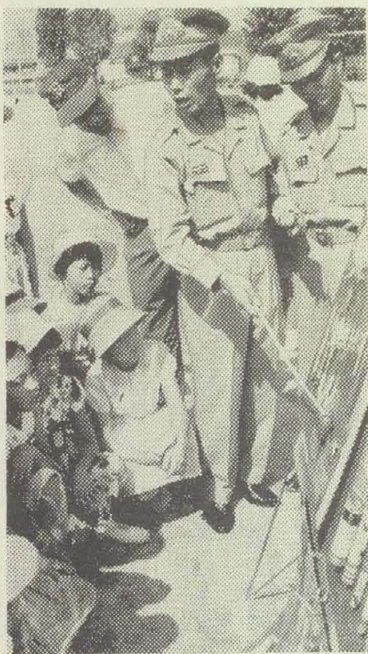
消防員から花火の正しい遊び方を聞く子どもたち

また、七月中ごろ、各地区の制水弁をかりかえて低区配水池の水を通しますが、次のようなことがおのります。 各地区の洗管作業の日時と切り替えの日は、前日に広報車でお知らせします。 夏の間、水がにごりますので、よく調べてからお使いください。 水圧が変わりますので、漏水する場合があります。