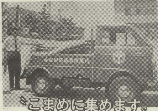
こまめに集めます

■講習の日時と場所 今月27～28日(午前9.30～午後4.30)、八尾信用金庫本店(本町2丁目)で