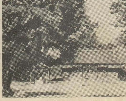
大銀杏樹(矢作神社の社殿)

中部の巻(成法寺、別宮、八幡宮、二俣) 本号からは、前回までの中部の巻に引き続き、平野部の南北にまたがる中部の巻を連載します。この巻は成法寺、別宮、八幡宮、東山、一俣から市内の南北を流れる玉川に沿って北に向い、都塚、柏村、上之島、樺万寺を訪れ、さらに西郷、菅原、穴太の史跡をたずねます。