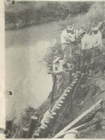
7月の集中豪雨による災害の復旧工事現場

○41年度一般会計第三号補正予算 助金などの総額が、他の補正予算と比較して、少額である点を強調し、この事業が補助対象にならなかつた理由を尋ねました。また、従来の災害復旧工事は、災害を受けた個所の原形回復として行われてきたが、災害復旧事業として行われるべきではないかと、質問しました。