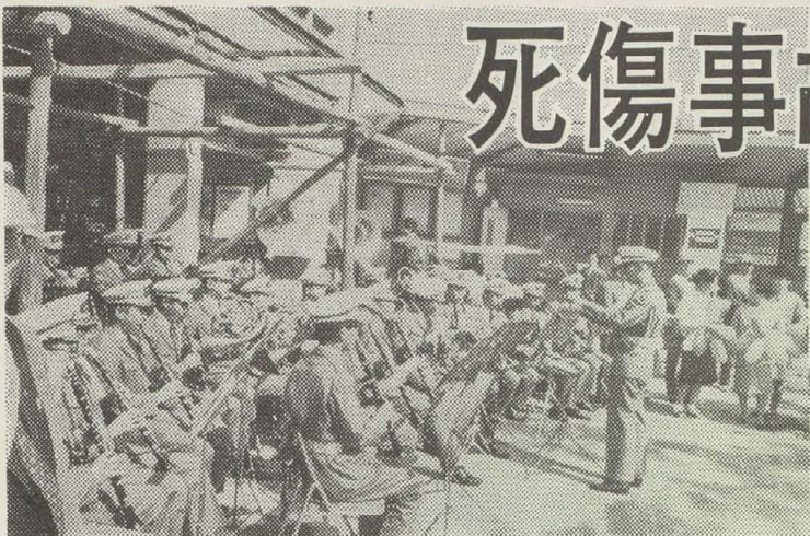
近鉄八尾駅前交通安全のPRの応援にかけつけた府警吹奏楽団