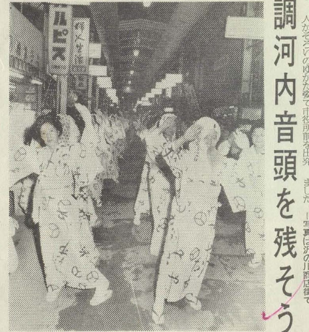
婦人会、商店街をねり歩く

八月二十日(月)北高安小学校 二十三日(火)中高安小学校 二十四日(水) 二十五日(木)隣保館(種町) 二十六日(金) 二十九日(月)大正中学校 三十日(火)大正小学校 三十一日(水) 時間は、いずれも午前九時半から午後三時までです。なお、前号でお知らせしました市では、八月三日、九日付で次の