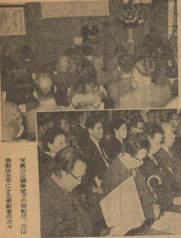
写真①は議事堂での表彰式、②は表彰状を手にする受賞者の方々の様子