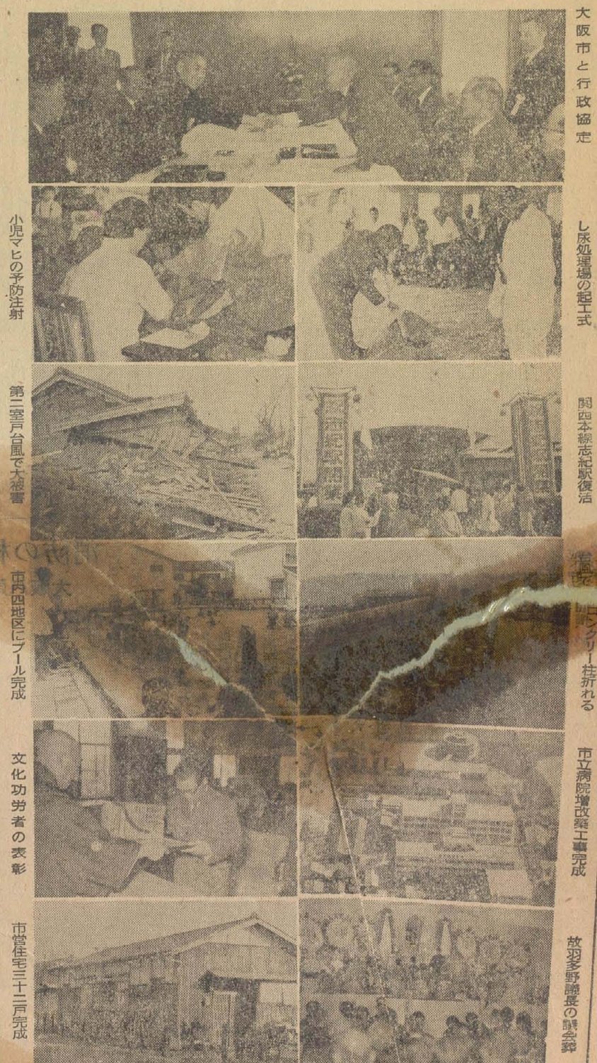
大阪市と行政協定 し尿処理場の起工式 関本線志紀駅復活 市立病院増改築工事完成 放牧野野長崎の講堂 市立病院増改築工事完成 文化功労者の表彰 市立病院増改築工事完成 市立病院増改築工事完成