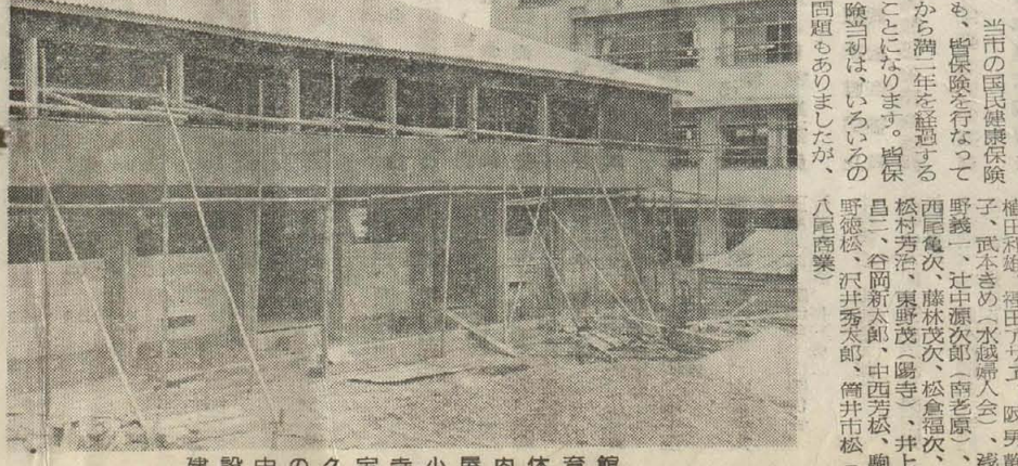
建設中の久宝寺小屋内体育館

納税額に比べて最高三パーセントの補助金を、取扱った令書、通について十円から五十円の補助金が交付されるほか、納税成績のよい組合は表彰されます。