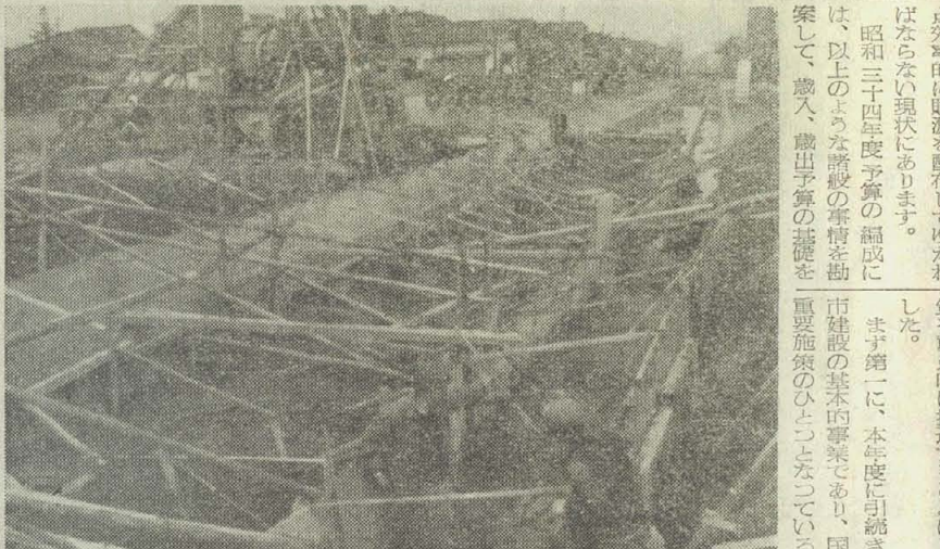
下水道分岐方式による長瀬川改修工事一大信寺付近

とき 四月十五日 二時一四時 ところ 八尾市役所 人権を犯されてお困りになっておられる方は、ご相談においで下さい。相談内容の秘密は厳守します。