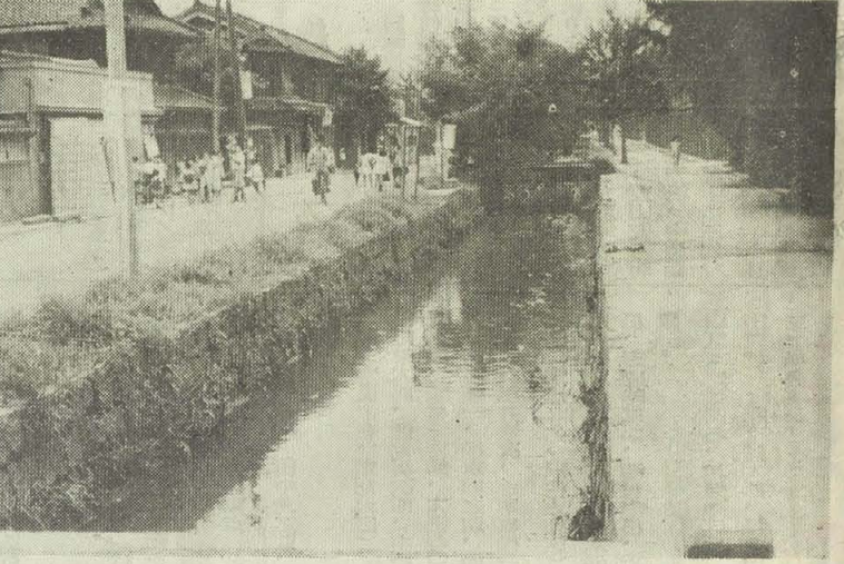
「写真説明」玉串川の川比較... 上流(八尾市内) 下流(大阪市内)

△治水対策協議会の基本方針... 各河川の治水... 治水対策協議会を設立しました。