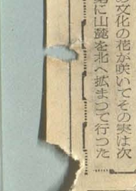
救済米に喜ぶ児童