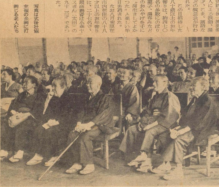
写真は祝寿式の様子