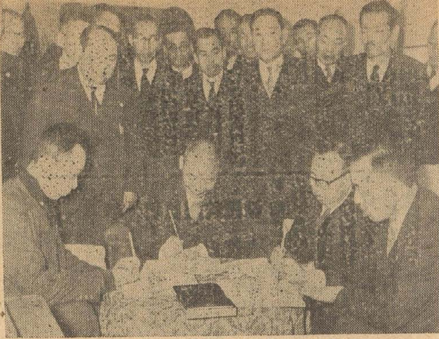
合併申請書に調印する市町村長

本市が昭和二十三年四月一日市制施行以来、市勢の伸張著しく、都市施設の整備も各方面に充実し、充足以来健全財政を堅持し、下水道の拡張、綜合病院の建設、小中学校の整備、府営住宅の誘致等全国都市に劣らぬ飛躍を遂げ、本年二月一日河内市福万寺、上之島を編入して今日に至っている。