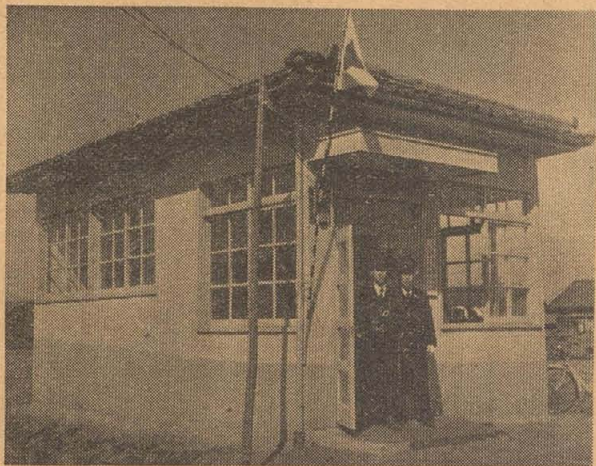
本水道事業は当初より一般会計と分離特別会計として経営... 本水道事業は当初より一般会計と分離特別会計として経営...