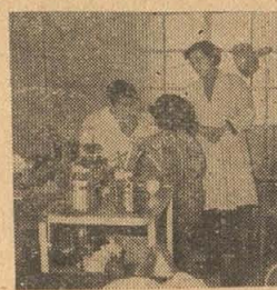
(西郡診療所の様子)

西郡診療所の施設と診療内容。西郡診療所の施設と診療内容。西郡診療所の施設と診療内容。