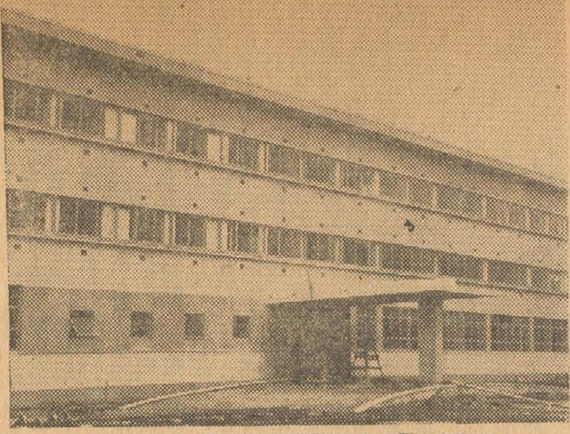
完成なつて二日から診療開始した八尾市立病院

一月定例市会は去る二十一日午前十時開議にて開催され、八尾市職員給与條例改正の件ほか八議案の審議に入つたが、各委員会で慎重に審議し、二十六日の本会議で六議案を原案可決三議案を決議委員会に付託した。 本追加予算として一般会計に一九九三万六千六百六十九圓四角三分八厘が承認可決された。