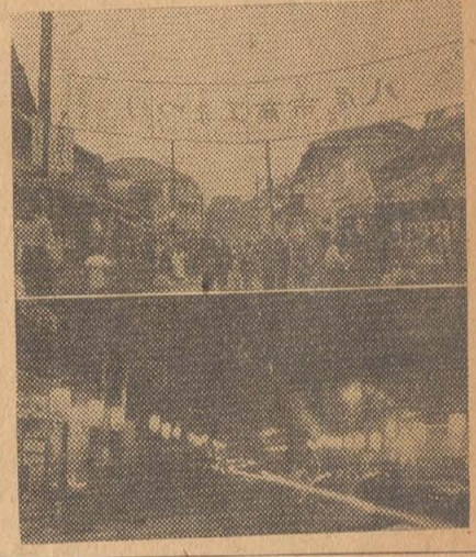
夜の人氣をさらった 仮装行列コンクール 二十五日からはじまった仮装行列も二十七日の決勝日には我々も集った仮装行列が大会で色とりどりの思いつきに賞賛も厚く披露した、入賞者は次の通り...