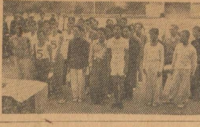
叫びの声の呼ぶマラソン大会 二十七日行われた市内十三キロにわたる各出張所巡り(大正)龍華一久寺(山本)西郡(本)の順伝の参加チームは一般六人、学生八チームの十四チームで午後二時大正出張所前を出発...