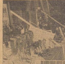
写真は展示品の一部(上)と会場(下)