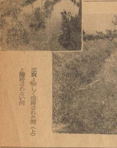
写真：美しく清掃された河川と清掃された河