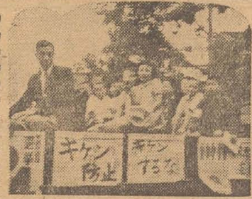
(写真は児童乗降防止運動)

昭和二十五年五月十九日追加予算の主なる科目は歳入を繰り越す本臨時市会への繰入... 歳入追加豫算額 一七、七〇〇八八八円