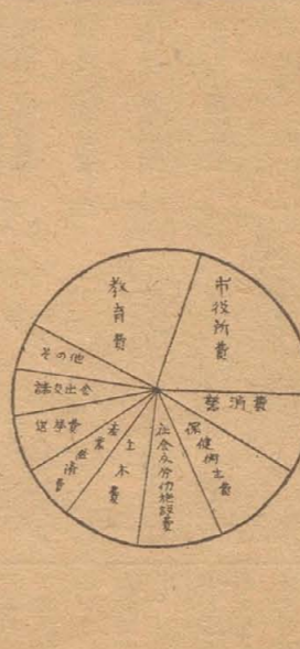
この数字をわかりやすく圖に表わすと次の通りであります。