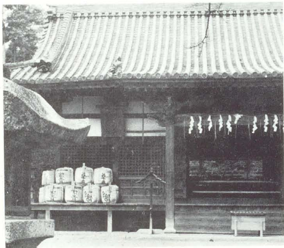
恩智神社の夏祭り

文徳天皇の嘉祥3年10月に贈正三位、清和天皇貞観2年正月27日に贈従二位とあって、朝廷の信仰があった。