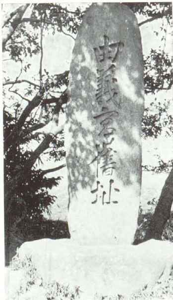
由 義 の 宮 跡

神立から十三峠への途中に石の地藏尊が祀られている小堂がある。昔、この峠が通行人の多かった頃、茶屋のあった所で、その茶屋には清らかな水の湧く泉があって旅人を喜ばせていた。その水が何時の頃からか薬水で脚気には大妙薬ということが伝えられ、地藏に詣でて、その薬水をもらい病人に与えるようになり、今も参詣人が多い。付近には桜が数十本樹えられていて春は花見客でにぎわっている。