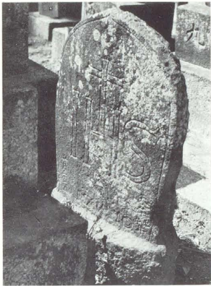
西郷墓地にある切支丹墓碑

も、この土地だけは藪笹が繁茂していたようで、またこの地に次のような伝説が残っている。切支丹禁制の令厳しく教会堂も破毀せねばならなくなったのでその鐘をこの地下深く埋没したが、不思議や夜が更けると地下で鐘がうらめしそうに鳴り響いたといわれている。