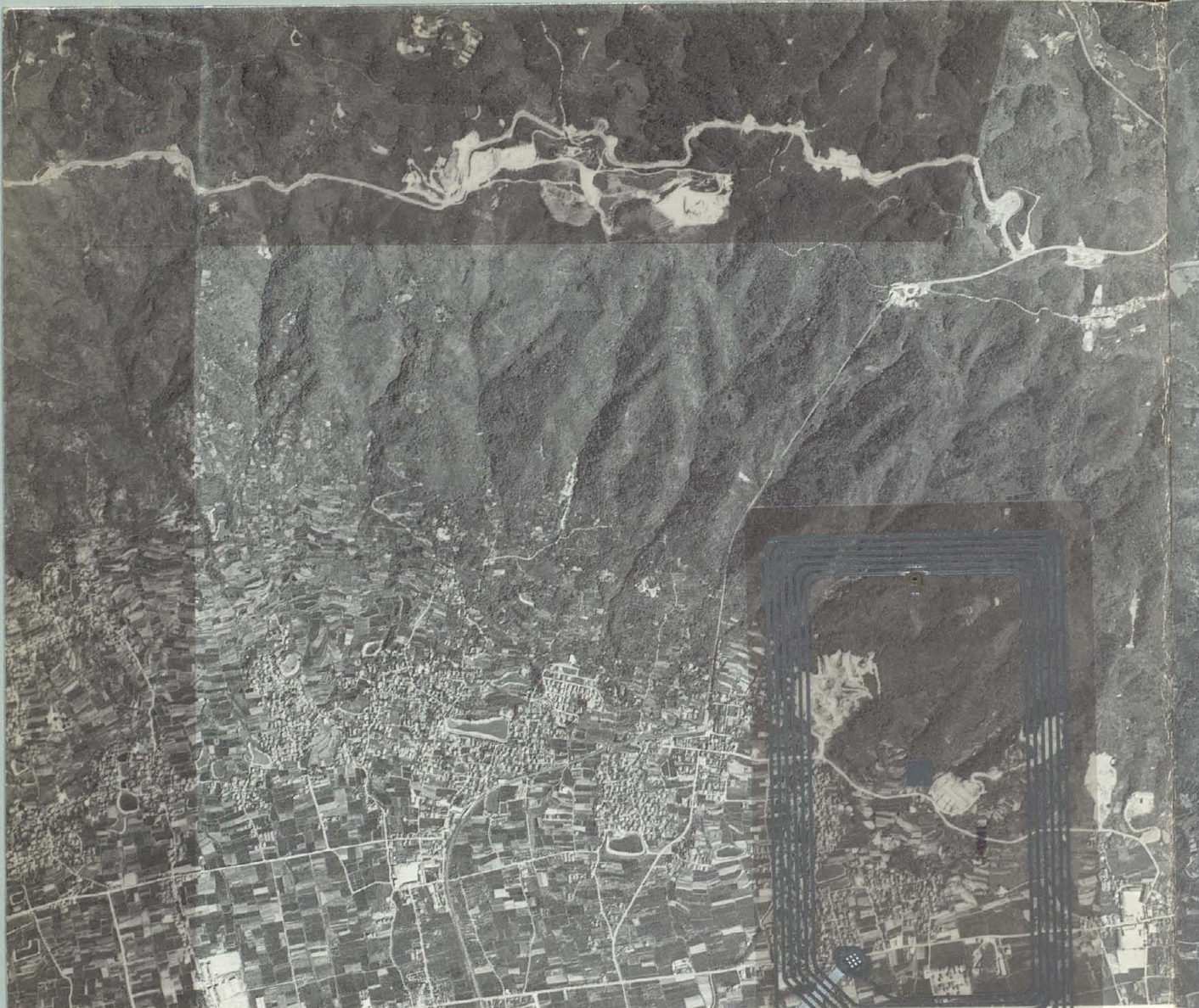
開発またれる山麓部を空から望む（上部にみえるのは奈良県境の