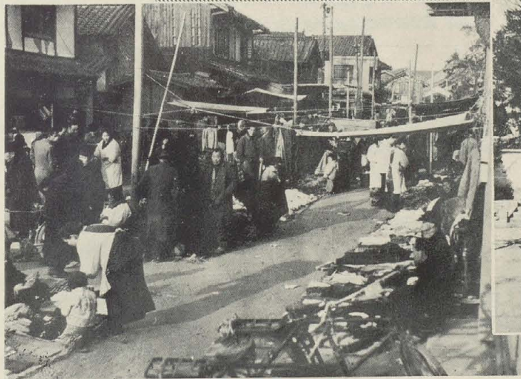
河内名物 お漣夜市に集いよる人々