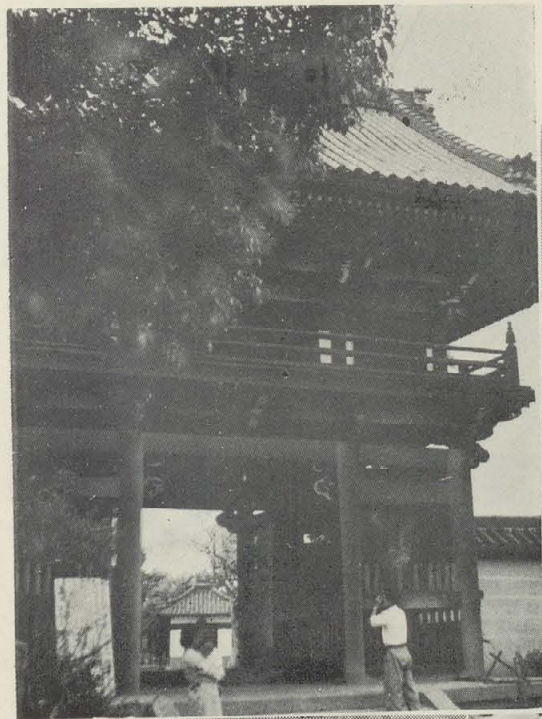
常光寺正門（左）と同寺境内の河内名物地藏踊り