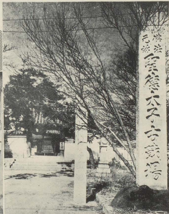
聖徳太子が物部守屋を 討ちし古戦場