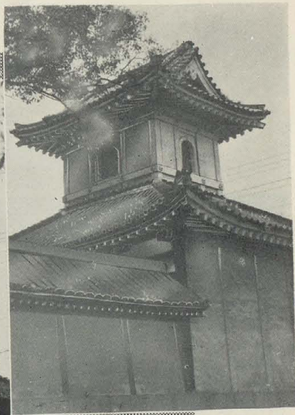
大信寺（通称八尾御坊又は八尾別院と呼ばれる真宗大谷派の別院）（左）同寺太鼓楼（右）御野立所（中央）